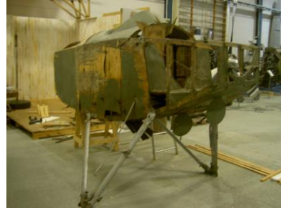
Samlingarnas exemplar vid restaureringens början

Tillverkare: Nordiska Aviatikbolaget , Midsommarkransen, Sth. Tillv.nr: Nr 11 ? År: 1917 Motor: Scania-Vabis Spännvidd: 13,00 m Längd: 7,80 m