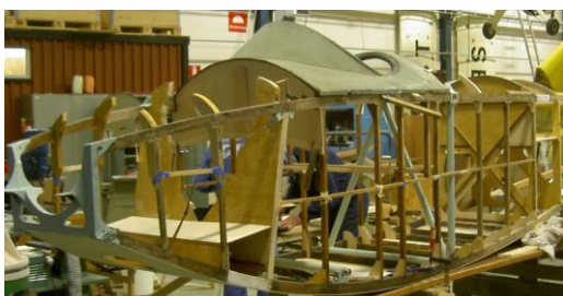
Samlingarnas Albatros januari 2008

Alla spant är nu på plats och limmade till de fyra longerongerna och riktade. Anpassning har påbörjats för montering av detaljer.